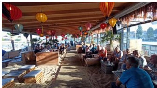
Rest. Sandoase, Basel beim Kaffee + Gipfeli