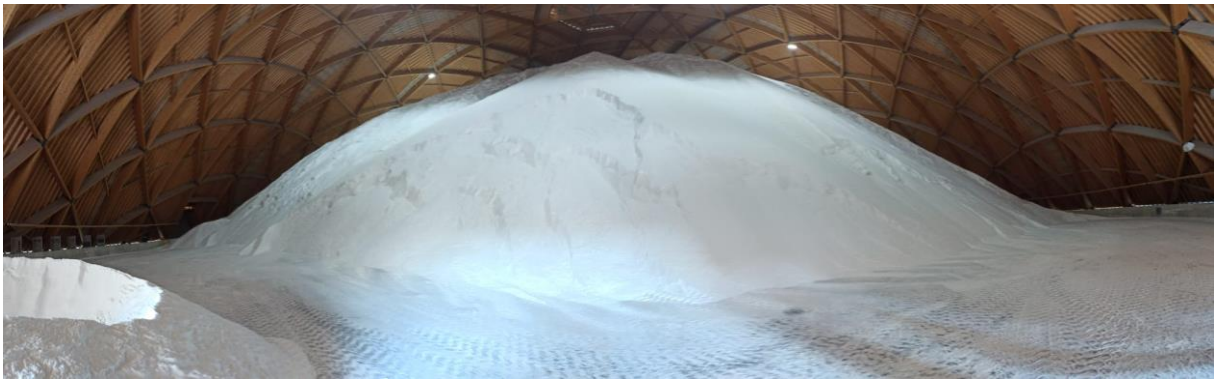
Salzberg in der Saline Riburg